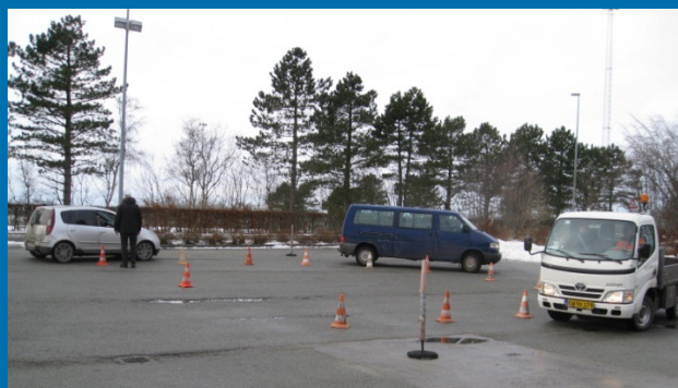
Bakke på en strækning formet som et U.