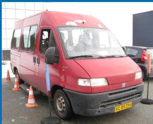
Bakke ind i en bås

Alt i alt 2 vellykkede dage med stof til eftertanke. Nu er det op til de enkelte institutioner/afdelinger, at holde gryden i kog og ændre vaner, når det gælder mental køreteknik. Dette kursus blev afholdt for midler fra risikostyringspuljen.